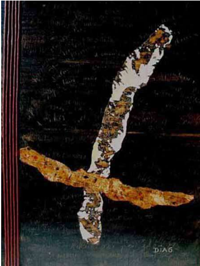
Requiem 100 x 140

Pays de couleurs, d'ombres et de lumières. Pays de matières et de signes qui écrivent les égratignures de la vie.