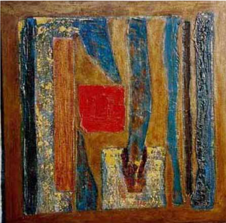
Déchirures 90 x 90

Loin de la dénonciation et du mysticisme, Diag peint la communion avec générosité et rythme.