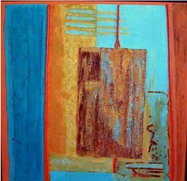
Chronos 90 x 90