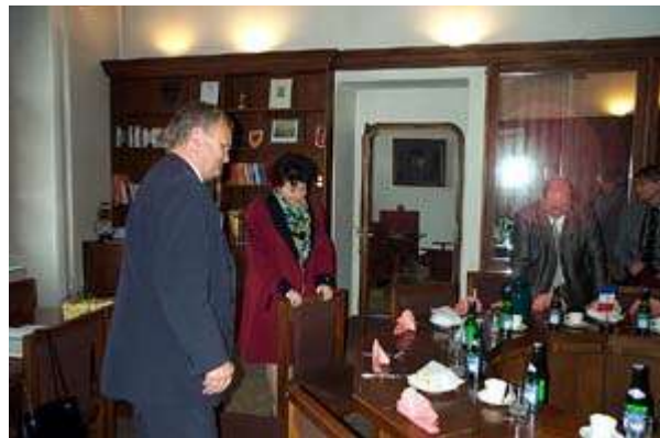
Réception par Monsieur le Maire de Tàbor Lors de la réception, nous faisons la connaissance d'une vingtaine d'artistes régionaux.

Tàbor : Ville royale, la ville de Tàbor avec ses 37000 habitants se situe en Bohême du sud. Cette région se distingue par ses beautés naturelles, ses étangs ainsi que par ses remarquables architectures urbaines et rurales. Ville d'art, en outre de son musée Hussite et d'une architecture d'exception, Tàbor possède de nombreuses galeries d'art ainsi qu'un musée privé remarquable.