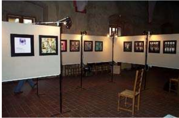
Aperçu de l'exposition