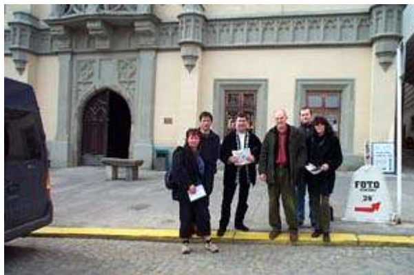
Les artistes français devant le musée Hussite.