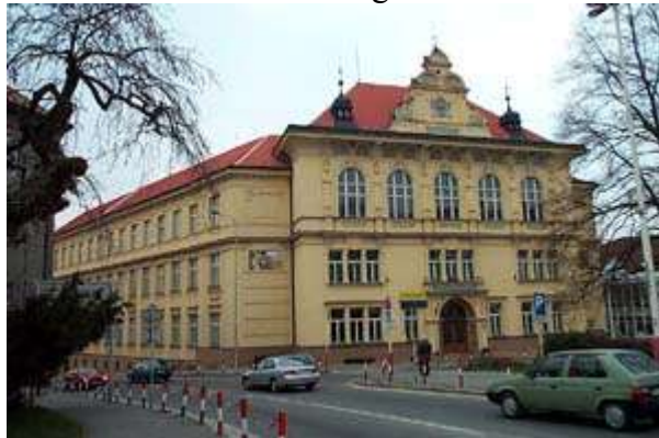
Le lycée Pierre de Coubertin de Tabor