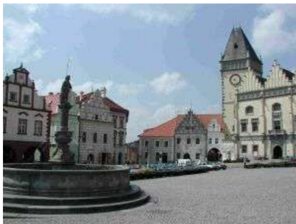
La place centrale de la ville

Tàbor : Ville royale, la ville de Tàbor avec ses 37000 habitants se situe en Bohême du sud. Cette région se distingue par ses beautés naturelles, ses étangs ainsi que par ses remarquables architectures urbaines et rurales. Ville d'art, en outre de son musée Hussite et d'une architecture d'exception, Tàbor possède de nombreuses galeries d'art ainsi qu'un musée privé remarquable.